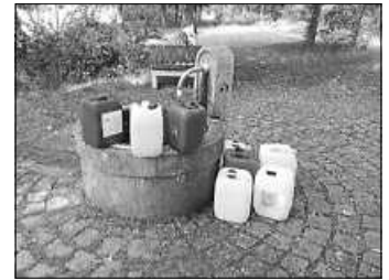
Der Oberbrunnen liefert kostenloses Gießwasser. Am Sonntag, 9. Juli 2023 wird er zum Freie Wähler Festplatz.

Wall zum Brunnen und die auch als Radweg gerne genutzte Verbindung setzt sich nach der Überquerung der Nord-/Südstraße in westlicher Richtung ins Gewerbegebiet fort. Von Renningen wird der Oberbrunnen über den Feldweg an der Westseite der Nord-Süd Straße erreicht; aus den Baugebieten Schnallenäcker I und II und aus dem Zentrum von Malmshheim durch das neu erschlossene Baugebiet oder über die Lilienstraße und dann entlang der Nordrandstraße. Der Brunnen liefert das ganze Jahr kostenloses aber nicht trinkbares Wasser. Weil er frei zugänglich ist, nutzen Gartenbesitzer den Brunnen gerne zum Befüllen ihrer Wasserbehälter. Seit vielen Jahren findet auf der Wiese neben dem Brunnen die Sommerhocketse der Freien Wähler statt – in diesem Jahr am 9. Juli 2023. Machen Sie bei uns eine Rast. Wir freuen uns in einer ungezwungenen Atmosphäre auf gute Gespräche bei Essen und Getränken. Zum Kaffee bieten wir selbstgebackene Kuchen an. Bei gutem Wetter von 12 bis 15 Uhr Ponyreiten. Alfred Kauffmann Schriftführer