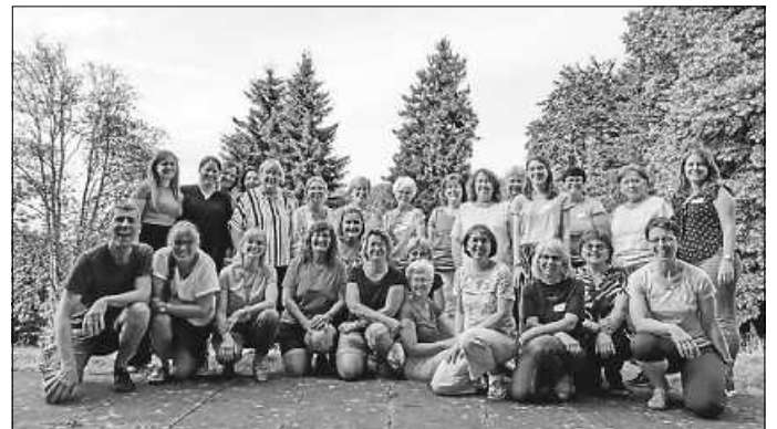
In schöner Kulisse: die Voices of Joy Renningen bei ihren Proben- tagen in Bad Herrenalb.