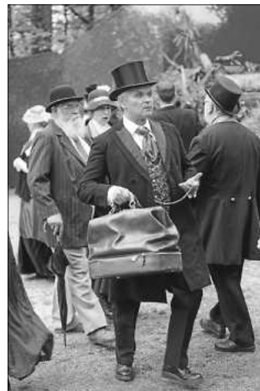
Ob es Phileas Fogg schafft, in 80 Tagen um die Welt zu reisen?

Am kommenden Samstag, 01.07.23 , präsentieren wir die Premiere des Abendstücks „In 80 Tagen um die Welt“. Regie führt Jürgen von Bülow. Die Vorstellung beginnt um 20 Uhr .