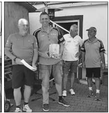
Der glückliche Hole-in-one-Spieler