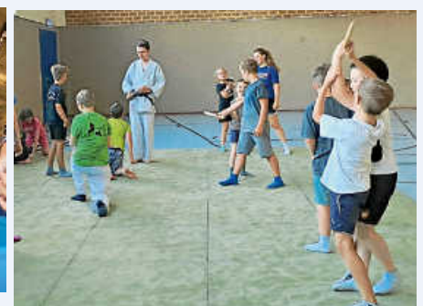
Aikido Schnupperkurs des TSV Malmsheim

Die Stadtverwaltung bedankt sich bei allen Organisatoren und Helfern der über 60 Veranstaltungen des Sommerferienprogramms ganz herzlich für ihren bemerkenswerten ehrenamtlichen Einsatz, ohne den das Sommerferienprogramm nicht stattfinden könnte!