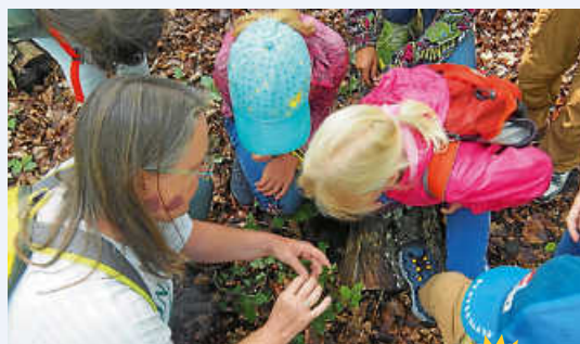
Den Wald erleben mit „WIR“ von der Wald Initiative Renningen