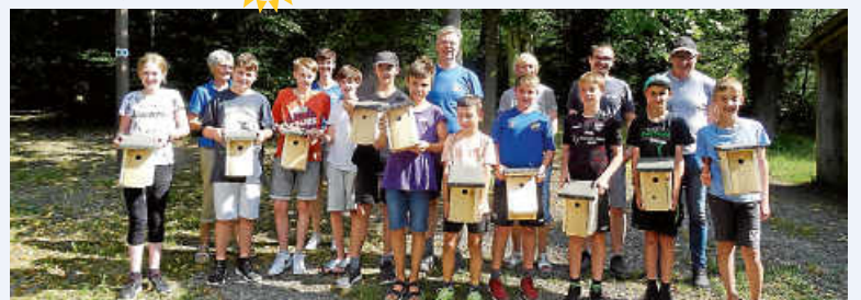
Vogelnistkästen mit dem NABU selber bauen