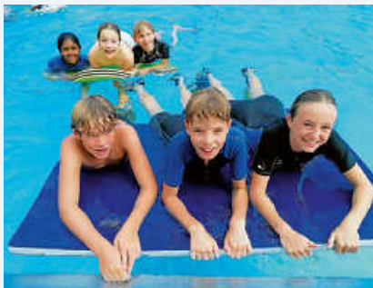
Schwimmen, Tauchen, Springen mit dem Renninger Schwimmclub

Am 7. September fand leider schon die letzte Veranstaltung des diesjährigen Sommerferienprogramms statt. Dank des großen Engagements zahlreicher örtlicher Vereine und Organisationen war es auch in diesem Jahr wieder ein schönes und gelungenes Programm, das den teilnehmenden Kindern und Jugendlichen großen Spaß gemacht und für abwechslungsreiche und interessante Ferien gesorgt hat. Wie sich dies bereits im Vorjahr sehr gut bewährt hat, erfolgte die Anmeldung zum Sommerferienprogramm auch in diesem