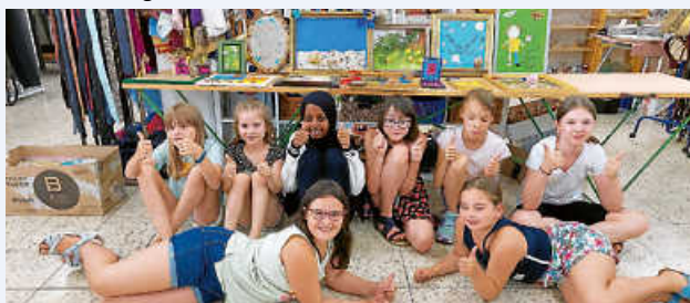
„Kunst im Rahmen“ im Malmsheimer Laden