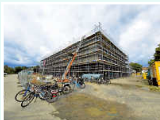
Neubau der Riedwiesensporthalle