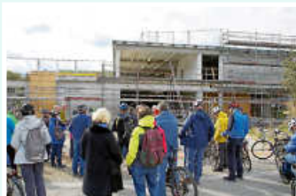
Sanierung und Erweiterung der Realschule Renningen