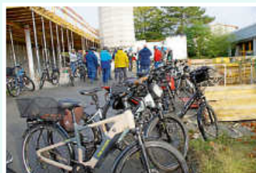
Erweiterung und Umbau der Friedrich-Silcher-Schule