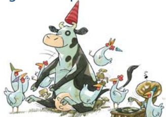
Illustrationen: Verlag Fischer Sauerländer

Anschließend ist die Mediathek von 16 – 17 Uhr mit allen Angeboten für jedermann geöffnet: Lernen Sie das große Angebot der neuen Mediathek kennen - ganz entspannt an einem Sonntagnachmittag!