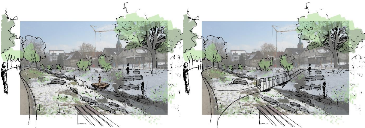
Ideenskizzen für eine Aufwertung des Rankbach-Ufers im Bereich Renningen (aus Rahmenplan Stadtmittte Bahnhofstraße)