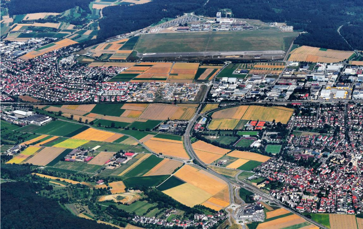
Potenzialbereich für eine attraktive Grüne Mitte zwischen Renningen und Malsheim