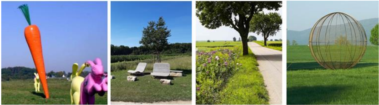
Beispiele zur Gestaltung der Landschaft