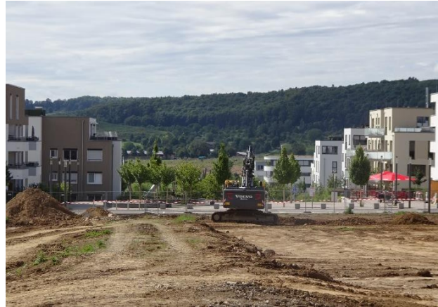
Blick von Schnallenäcker über den Schnallen- äckerpark nach Süden