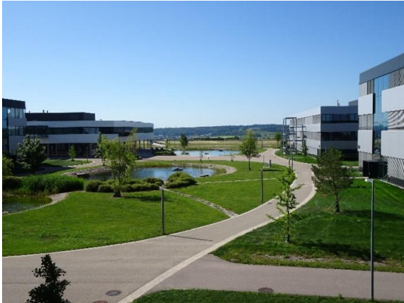
Grüne Achse des Bosch Campus, Blick in Richtung Süden